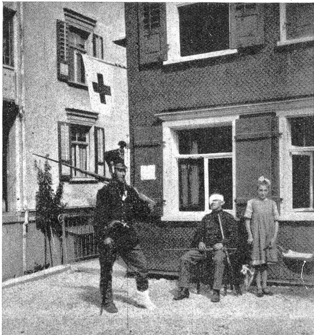
Eine fröhliche Erinnerung aus dem W. K. Souvenir du cours de répétition.

Die Gewehre standen nun im Rechen vor dem Kantonement, versehen mit Etiketten, und wir, wir standen in fabelhaften, in den Knien leicht gebogenen Arbeitshosen, die noch ganz anders nach Mottentod dufteten und schon jahrzehntelang geduftet haben mochten, und in Exerzierkitteln mit rötlichen Nähten und nötlichen Flickern — und die nigelnagelneue Herrlichkeit des Waffenrocks mit Zutaten war nicht zum Zwecke