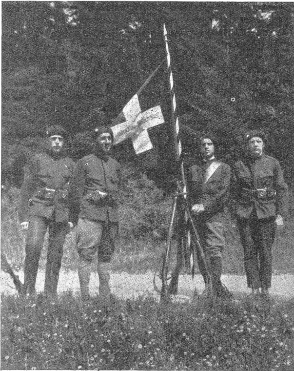
Die Neuenburger Jungwehrfahne. Le drapeau de la Jungwehrgarde des Neuchâtel.

lassen haben, denn wir wurden bald zum Gegenstand der Neugierde von Vielen. Der kurze Aufenthalt erlaubte uns, sich schnell in den Hallen umzusehen oder etwas zu kaufen. Da sich zu dieser Zeit des schwachen Verkehrs zufolge wenig Interessantes bot, waren wir froh, als wir unsere Reise fortsetzen konnten.