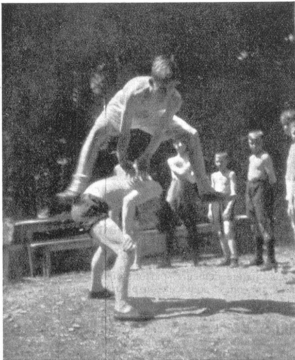
Exercices de gymnastique.

O morts, chers morts de 1918, soyez remerciés, soyez bénis: Fribourg qui se souvient ne vous a pas oubliés et ne vous oubliera jamais, car jamais sa reconnaissance ne sera à la hauteur de votre simple et sublime sacrifice.