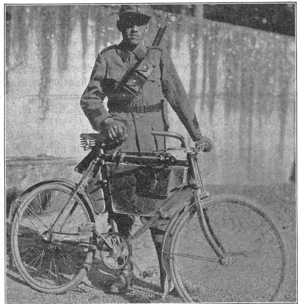
(M. Kettel, Genf.)

und Gegensätzen erfüllt ist, setzt es sich mehr als viele andere Staaten allen Erschütterungen des alten Europa aus. Es wird nicht umsonst dessen Drehscheibe genannt. Da wo im Frieden die grossen Verkehrsstrassen durchführen, suchen sich von Alters her auch die Kriegsheere zu bewegen. Bricht ein Streit aus zwischen unsern Nachbarn, so stehen wir sofort in Gefahr, mithingezogen zu werden. Wie unvermutet und rasch diese furchtbare Möglichkeit sich zeigt, haben wir im Jahre 1914 erfahren; sozusagen von einem Tag zum andern