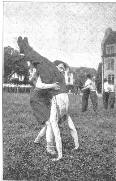
Handstandstehen mit Unterstützung.