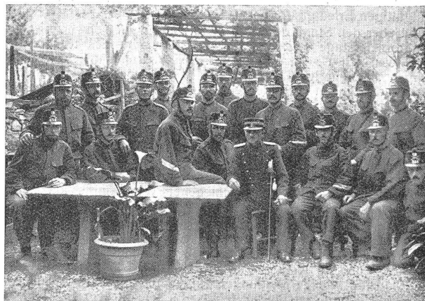
Auch wir lesen den «Schweizer Soldat» mit Vergnügen! Nous aussi nous lisons le «Soldat Suisse» avec plaisir!