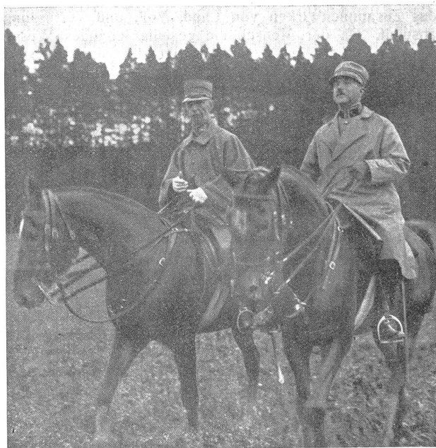
Erinnerung an Oberstkorpskommandant Steinbuch . Eine der letzten Aufnahmen.

a) Schutzaufgabe : Die erste und wichtigste Aufgabe des Staates ist die Wahrung des Friedens nach innen und aussen. Im innern schützt er den einzelnen in seinem Besitz und hinsichtlich der Sicherheit seiner Person; erst durch diesen Rechtsschutz macht er die Kräfte der einzelnen für die Verfolgung höherer Ziele frei. In gleicher Weise übernimmt der Staat den Schutz gegen Angriffe von aussen. Erste Voraussetzung für Erfüllung dieser Aufgabe ist, dass der Staat das erforderliche