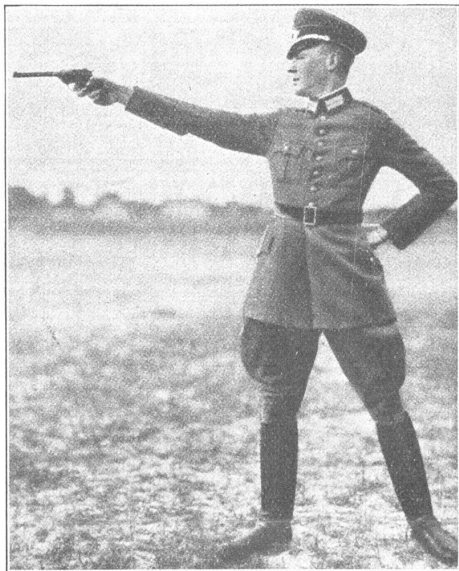
Oberleutnant Hax, Deutschland, der beste Schütze an der Olympia in Amsterdam. Premier-lieutenant Hax (Allemagne), le meilleur tireur aux Olympiades d'Amsterdam 1928.

Depuis un instant, je ne dormais plus. «Déjà!» murmurai-je! — C'est mon tour de pose. Je me lève pour avoir le temps de m'emmitoufler avec soin. Mon passe-montagne! le voilà. Mes gants, mes mitaines. Et ma cou-