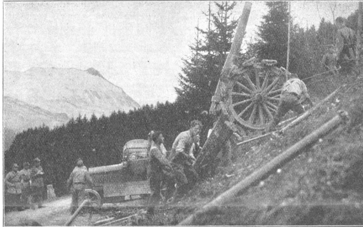
Tour d'adresse d'artillerie.

gegen einen Friedensbrecher auch an militärischen des Völkerbundes teilzunehmen. Würde die Schweiz abrüsten, also beginnen, sich der Mittel zur Erfüllung ihrer Pflichten zu entledigen, so käme das gleich der Vorbereitung zum Vertragsbruch.