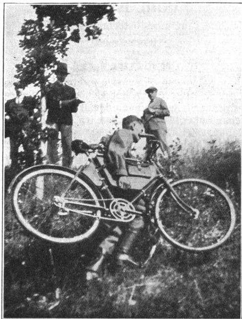
Championnat romand militaire. (Wassermann) Aufstieg, — Un passage difficile.