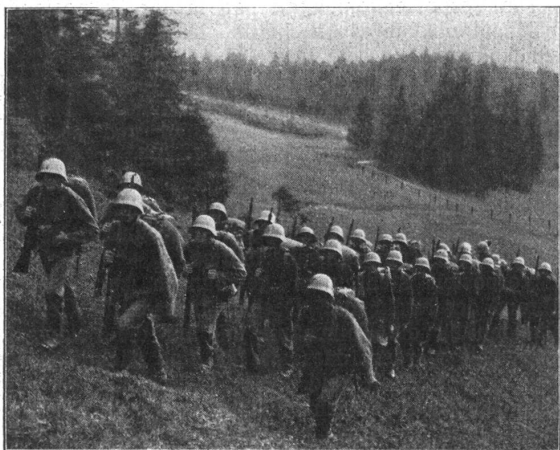
•Im Marsch. — En marche.

Gespannte Aufmerksamkeit ist die Hauptsache.