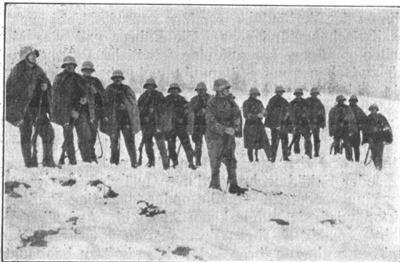
Zeltdecke als Regenmantel. Les toiles des tentes sont aussi utilisées comme manteaux pluie.