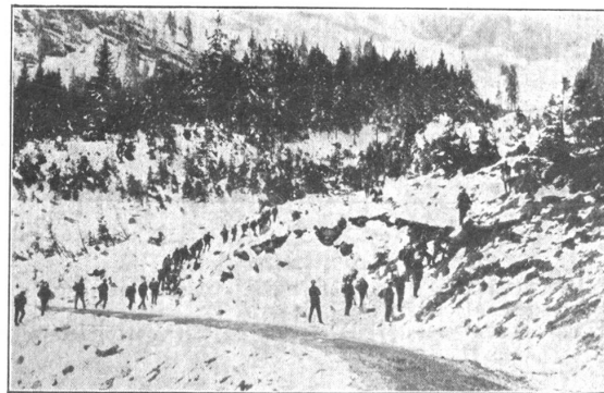
Vormarsch mit geöffneten Gliedern. Avance en colonnes ouvertes.