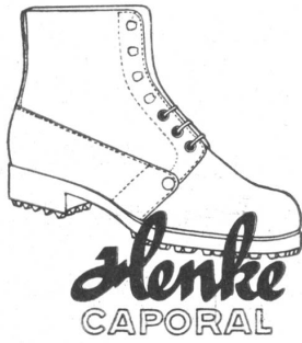
mit dem goldenen Absatznagel

trotzt schlechtem Wetter u. schlechten Wegen