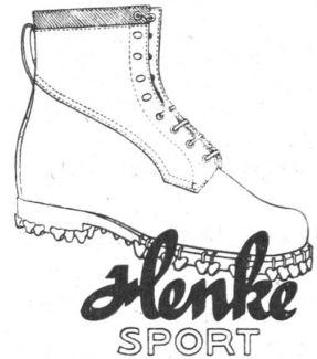
mit dem goldenen Absatznagel

trotzt schlechtem Wetter u. schlechten Wegen