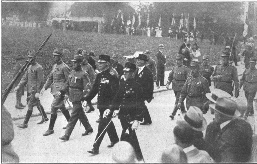
Schweiz. Unteroffizierstage — Journées suisses de Sous-officiers (Hohl, Arch.) Holländer Unteroffiziere und Zentralvorstand im Festzug — Le cortège. Sous-officiers hollandais et le comité central

Der Samstag. Die eigentlichen Wettkämpfe setzten erst am Samstag ein. Ein wohlthuendes Gewitter brachte mit dem anbrechenden Tag eine willkommene Abkühlung nach dem schwülen Freitag. Dampf dröhnte um 5.00 Uhr der rassige Trommelschlag durch die Stadt, die Unteroffiziere zu flinker Arbeit aufmunternd. Der Himmel machte anfänglich ein recht bedenkliches Gesicht,