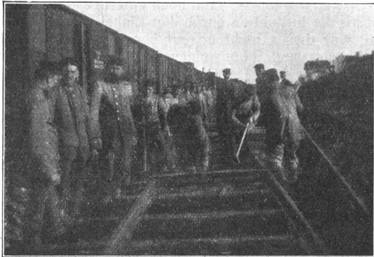
Deutsche Kriegseisenbahn. Erstellung eines Geleises. Chemin de fer de campagne allemand; pose d'une voie.

Der Pfarrer zog Luft zwischen den Zähnen hinein, was ein pferdeberuhigendes Geräusch verursachen sollte,