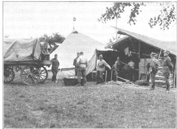
Vor dem Backofen. La manutention devant les fours.

Le magasinage, dirigé par le 1er lieutenant, Guidoux, reçoit les pains en dépôt pendant 24 heures avant leur mise en sac, pour permettre le «resuage» car l'on conçoit bien qu'il ne serait pas économique de distribuer du pain frais à la troupe. Les pains sont donc disposés sur des étagères adéquates, entièrement démontables et pourvues de lattes mobiles. La Compagnie dispose de 20 étagères de 24 rayons chacune pouvant recevoir 20 pains par rayon, il est donc possible d'emmagasiner 20 000 rations de pain. A Echallens c'est dans l'Ecole qu'a été installé le magasinage.