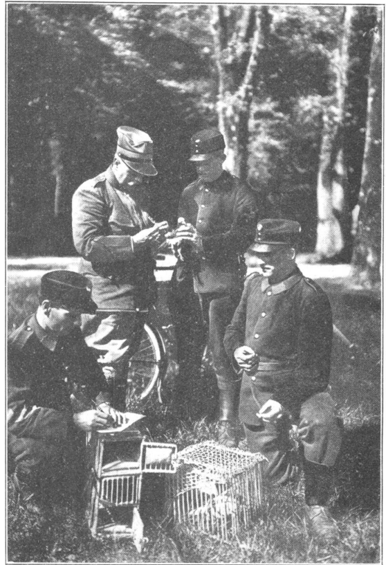
Brieftaubendienst. — Ankunft einer Meldung.

Hurra! Gerne wird auf die übliche Mittagspause verzichtet und 3.15 Uhr steht die Gefechtsbatterie wieder marschbereit im Park, und alsobald befanden wir uns auf dem Anmarsche auf gleicher Strasse, die wir am Mittag von Ponte-Bevera her befahren hatten. Ein empfindlicher Nordostwind blies uns um die Ohren, als wir nach scharfem Trabe zur befohlenen Zeit vor Madulein mit «rechts anhalten!» Halt machten. Da vorerst die Batteriestellung rekognosziert werden musste, gab es einen langen Halt, bei welchem wir fast die Knochen abfroren. Endlich, es mochte ca. ½6 Uhr abends geworden sein, kam Leben in die Bude, resp. diesmal in die