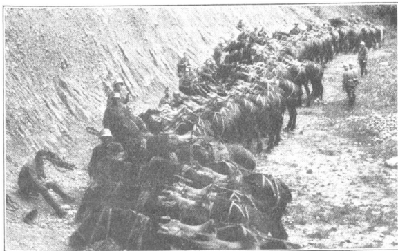
Wiederholungskurs der Batterie 20, in Leuk. Protzendeckung in einer Kiesgrube.

Ein Signal tönt über den Kasernenhof, verliert sich in den Gängen der Kaserne, geht schliesslich im Trillern der Feldweibelpfeifen und eiligen Schritten der sich in ihre Zimmer begebenden Mannschaften, unter. 21.30 Abendverlesen. Rapport . . . Befehl des Feldweibels: