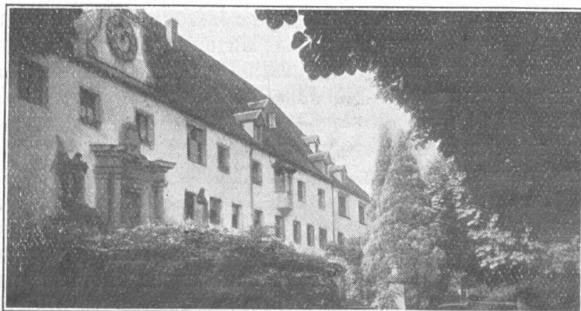
Lehrerseminar Marienberg — Séminaire de „Marienberg“