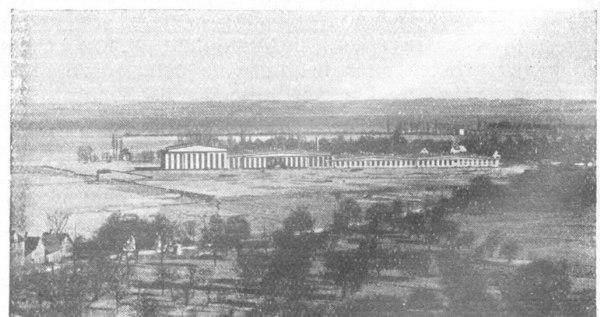
Dornierflugzeughalle — Halle des avions „Dornier“