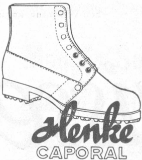
mit dem goldenen Absatznagel

trotzt schlechtem Wetter u. schlechten Wegen