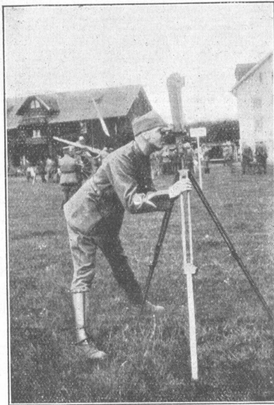
Schweiz. Artillerietage, Luzern. — Arbeiten an Batterie-Instrumenten.

Der Abend sinkt über das breite Tal und das Dorf, wo noch vor wenigen Stunden dichtgedrängt die Massen der Schlachtenbummler geduldig neben ihren Automobilen harrten und dem neckischen Gewehrgeknatter einen Sinn abzulauschen versuchten. Die unsichtbare Schlacht ist geschlagen. Einsam kreist noch ein einzelner Flieger wie ein Geier über den jenseitigen Höhen, dahinter der Feind in schwarzen Schwärmen verschwunden