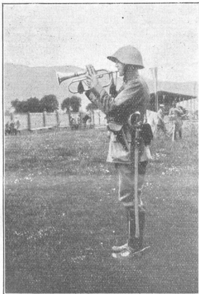
Schweiz. Artillerietage, Luzern. — Signalblasen zu Fuss. Journées suisses d'artillerie à Lucerne. Trompette-signaleur (ici à pied).

Wie aus einem Jungbrunnen entsteigen wir nach einer halben Stunde der traulichen Küche in die inzwischen völlig eingenachtete Welt. Dem tollen Wächter schleudern wir zwei grelle Lichtkegel von unsern Leibriemen her in die Schnauze, dass er sich knurrend verzieht.