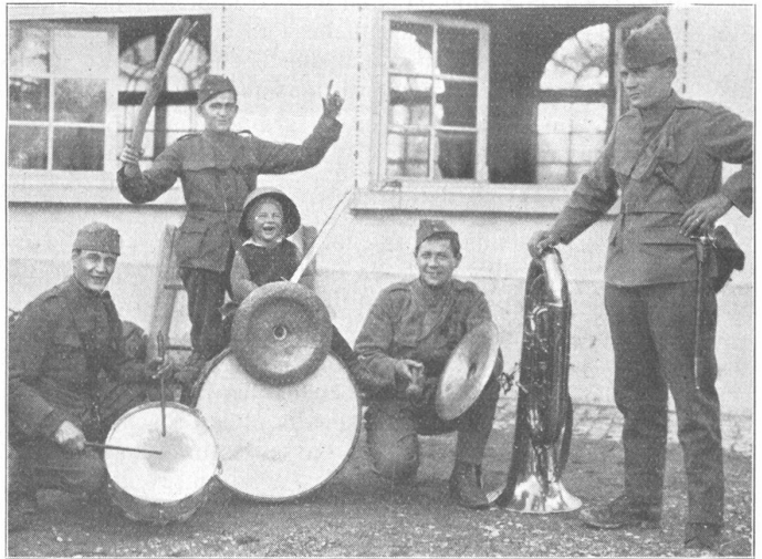
Die schöne Seite des Soldatenlebens: Nach dem Hauptverlesen. (Hohl, Arch.) Les côtés joyeux de la vie militaire: Après l'appel principal.

En 1914, la Suisse avait des obligations internationales. Le congrès de Vienne, en 1815, avait reconnu sa neutralité en échange d'une promesse solennelle: Notre