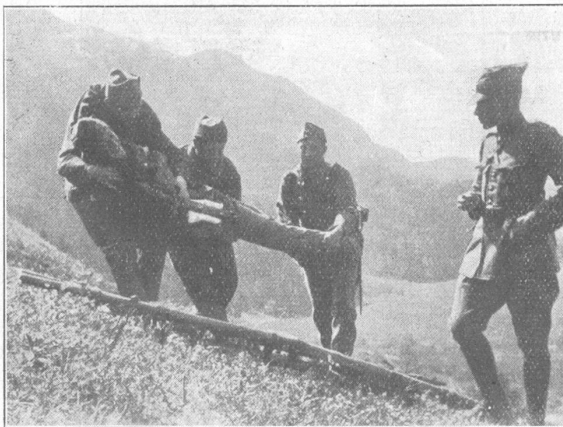
Die Truppensanität transportiert den Verletzten auf die bereitstehende Bahre.