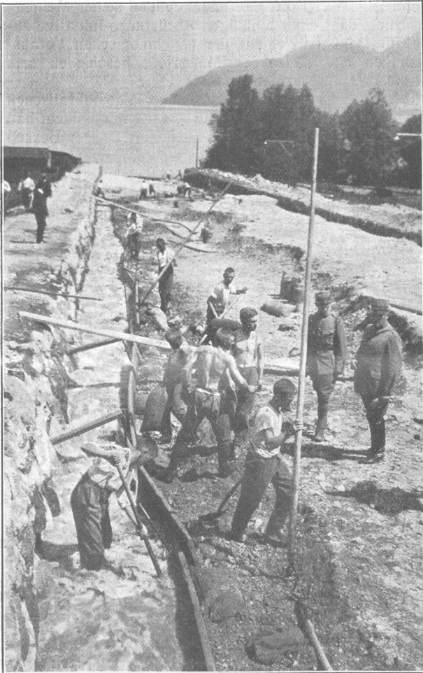
Kompagnie bei den Räumungsarbeiten am Lielibach in Beckenried (unteres Teilstück gegen den See).

eine Schaufel, einem andern ein Pickel, einem dritten ein langstieliger Haken in die Hand gedrückt, bis jeder irgend ein Instrument bereit hielt, und da war es eine Freude zuzusehen, wie eifrig gleich von Anfang an gearbeitet wurde. Reuten auch manchen zuerst seine schönen Exerzierhosen, so dauerte es doch nicht lange, bis er bis zu den Knien im Wasser stand, Sand schaufelnd und gewaltige Steine aus dem Bachbett holend, als ob er sein Leben lang nichts anderes getan hätte. Erwischte auch etwa einer von oben einen «Hauptspuck», so liess er sich deswegen nicht verdrissen, gab nicht klein bei, sondern sagte sich: Nun erst recht! Offiziere, Unteroffiziere und Soldaten betätigten sich da unermüdlich