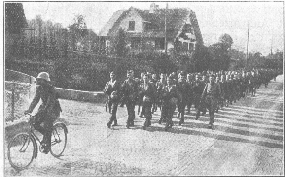
Kompagnie auf dem Marsche zum Hilfsdienste nach Beckenried. Compagnie se rendant à Beckenried pour aider aux travaux de déblaiement.

frischer, hauptsächlich im Bergeschatten marschierend, Stansstad erreichten. Aber als wir in Stans einrückten, da war manchem schon bänglich zu Mute, und nur wenige erkundigten sich hinten herum, wie weit es wohl noch wäre. Der Marsch war für die nach vier Wochen noch wenig trainierten Rekruten keine leichte Sache, und man hatte seine Freude an denjenigen, welche trotz wundgelaufenen Füessen es sich nicht nehmen lassen wollten, stolz zu Fuss in Beckenried einzumarschieren. Der Abend nahte heran, als wir den freundlichen Flecken Stans verliessen, nicht alle mehr auf Schusters Rappen: Autos hatten den Allzumüden den Weg von den Füessen,