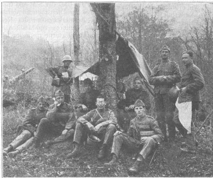
Station de téléphone