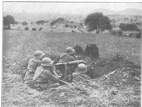
Maschinengewehre in Stellung. — Mitraillease en position.

Verfügen wir aber über eine ernst zu nehmende, durch unser Gelände in ihrer Handlung begünstigte Wehrkraft, so fällt jene so beängstigende Gefährdung weg.