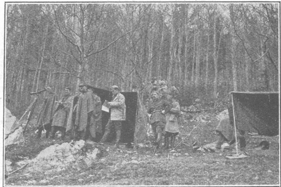
Beobachtungsposten der Feldartillerie auf der Schmiedenmatt (Jura). — Poste d'observation d'artillerie de campagne sur la Schmiedenmatt (Jura). (Hohl, Arch.)

Endlich sei auch hingewiesen auf die kaum messbaren Werte, welche aus all den reichen, über das ganze Land verbreiteten, engen, persönlichen und freundschaft-