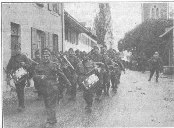
Gefechtsabbruch. — La fanfare salue la fin des hostilités.

Voraussetzung solcher Gestaltung ist unsere Opferbereitschaft, welche auch vor der Hingabe des Lebens