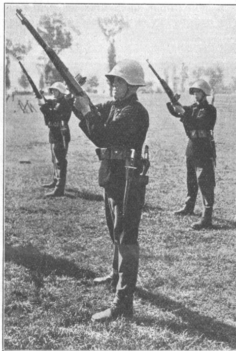
Das richtige Laden. (Dubois) La vraie façon de charger.

Ces considérations laissent voir pourquoi, pendant longtemps encore, nous conserverons le monopole d'une organisation de milices. Aucun pays n'osera tenter d'introduire un système particulier à nos conditions sociales, géographiques et politiques. Par ailleurs, il suffit de