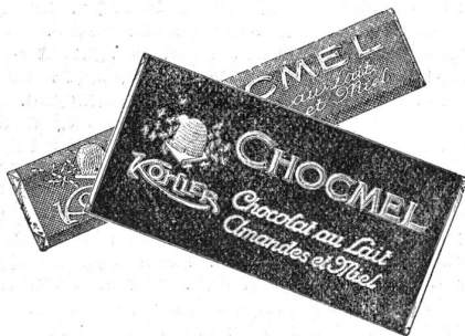
Ein nahrhafter Leckerbissen