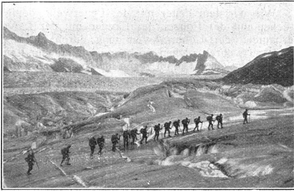
Unsere Truppen im Gebirge. Ueberquerung des Rhonegletschers.

Nos troupes en montagne. Traversée du glacier du Rhône.