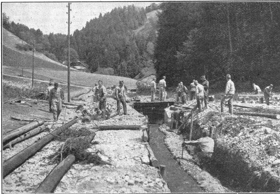
W. K. 1931 des Sap.-Bat. 3 im Unwettergebiet des Emmentals. Der weggerissene Steg wird ersetzt.

In letzter Nummer gaben wir unter «Militärisches Allerlei» Kenntnis von einem Vorfall, der sich in der Radfahrer-Rekrutenschule Winterthur abgespielt haben soll. Der Blitz soll