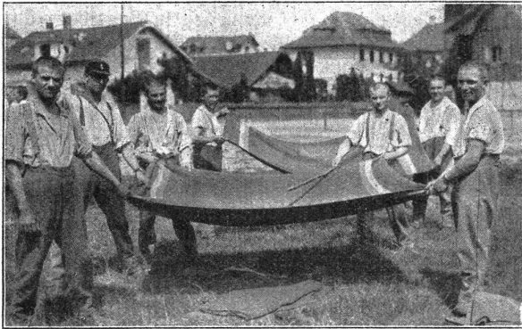
Mit vereinter Kraft: Gross-Reinemachen in der Kaserne. Et avec les bras de tous : le grand nettoyage sera plus vite terminé.

C'est ce moment que choisirent chez nous les chefs révolutionnaires pour tenter de réaliser leurs projets : renverser le gouvernement fédéral et prendre possession du pouvoir. Un spectacle affligeant se déroula sous nos yeux. Ces tristes meneurs réussirent à déclencher la grève générale. Toute activité cessa ; tous les services publics furent paralysés. La patrie fut gravement menacée. Le gouvernement reconnaissant le sérieux de la situation, mobilisa tout de suite une grande partie de l'armée, qui répondit à l'appel avec un enthousiasme admirable. Ce fut un spectacle réconfortant que de voir la tenue résolue de nos soldats, qui ne manqua pas de faire une profonde impression dans tout le pays. Les ambitions des chefs révolutionnaires furent rapidement et définitivement anéanties. La population reprit confiance en elle-même et sa reconnaissance alla à l'armée qui lui avait épargné les pires malheurs.