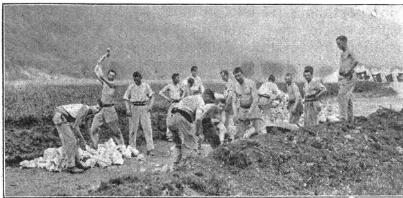
Mit vereinter Kraft: Flieger-Rekruten beim Strassenbau. Et avec les bras de tous: recrues des troupes d'aviation construisant une route.