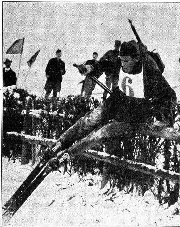
Hindernislauf. Die Weissdornhecke hat ihre Tücken. La course d'obstacles. La haie d'aubépine donne du fil à retordre aux concurrents.

in prächtigen Pulverschnee hinein zu geraten. Ergiebiger Schneefall mit Wind hatte eine schöne Före hingelegt, die nur auf den Höhen stellenweise sturmzerblasene Stellen zeigte. Der Samstag war in der Hauptsache dem Langlauf gewidmet, der auf einer Piste von 40 km mit Höhendifferenzen von insgesamt 1040 m viel Interessan-