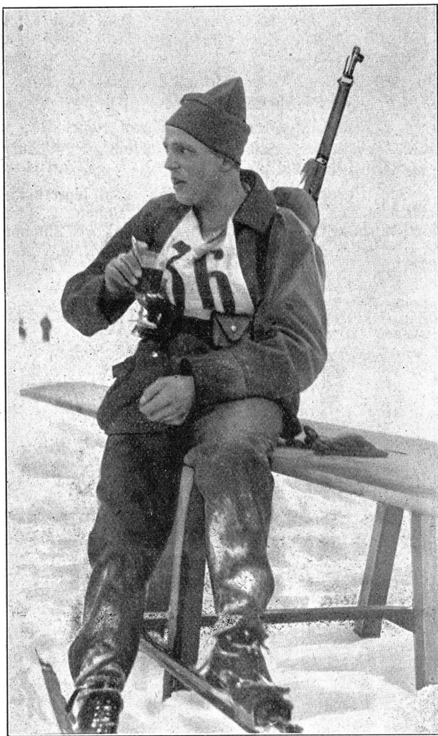
Ein Glas Tee nach dem mühevollen 40 km-Lauf ist nicht übel! Après 40 km de course pénible un verre de thé n'est pas de refus!