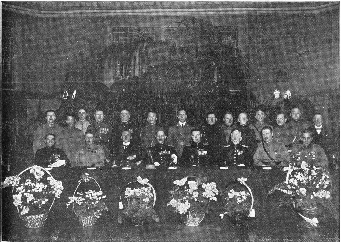
Obere Reihe: Franzosen mit Führer Casteleyn Engländer Dänen Schweizer mit Führer van Keulen Untere Reihe: Verbandsleitung des K. O. O. S.

Mannschaft bildeten sich zwischen dem Königlichen Unteroffiziers-Fechterbund und dem Schweizer Unteroffiziersverband freundschaftliche Beziehungen, die ihren Ausdruck darin fanden, dass für die Schweizer Unteroffizierstage 1929 in Solothurn eine Delegation von vier holländischen Unteroffizieren eingeladen wurde. Unsere Kameraden erinnern sich der prächtigen Gestalten, die bei uns den besten Eindruck hinterliessen.