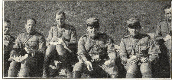
Schießkurs für Schw.-Mot.-Kan. Monte Ceneri 1932

Als Forderungen wurden unter anderem aufgestellt: Aus den Schulbüchern sollen Lesestücke, Lieder usw. entfernt wer-