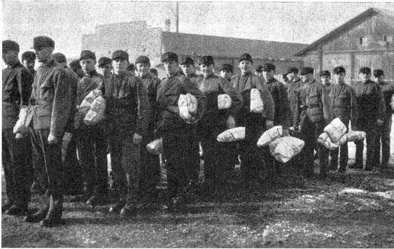
R.-S. I. der Motorwagentruppe Die Zivilkleider werden, säuberlich verpackt, nach Hause zurückgesandt. Auf Wiedersehen!

vom forschen Führer unterscheiden. Der Zaghafte wird in derartigen Situationen immer stürzen. Er fühlt sich dem großen Tempo nicht gewachsen und bekommt Angst, wenn sich die Geschwindigkeit immer mehr und mehr steigert. Dem Mutigen hingegen kommt alles leicht und ungefährlich vor. Darum steht er kitzlige Abfahrten