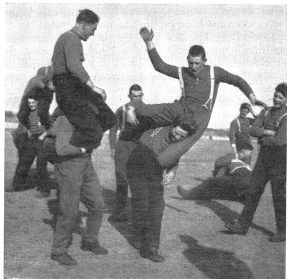
R.-S. I. der Motorwagentruppe Zweikampf auf den Schultern eines Kameraden wirkt anregend und stählt den Mut

Die Gasschutzkonferenz in Bern vom 9. November 1931, über welche hier bereits schon berichtet wurde, hat wieder einmal deutlich gezeigt, daß es noch weite Kreise in unserm Volk zu geben scheint, die der Ueberzeugung leben, unsere Schweiz könne erwirken, daß die ganze übrige Welt vom Gebrauch der chemischen Kampfstoffe