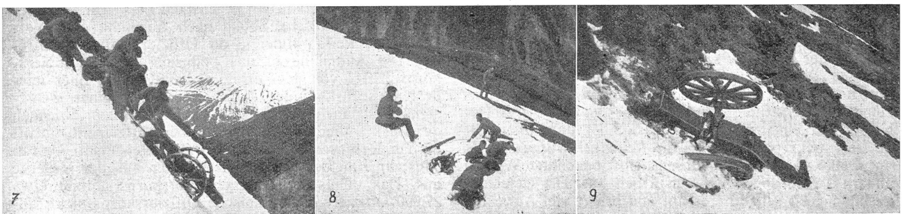
Unsere Gebirgsartillerie. — Notre artillerie de montagne.