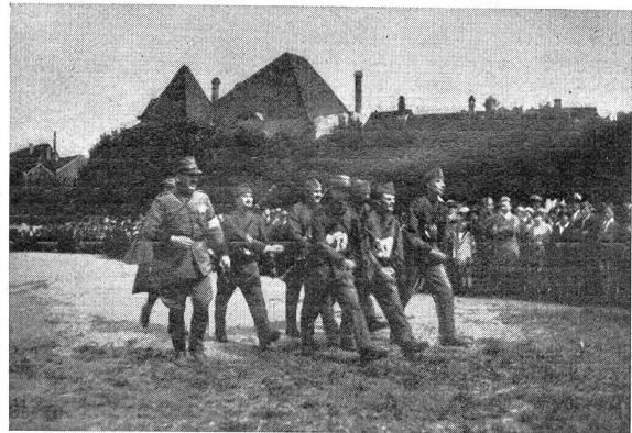
Ankunft der Patrouille Nr. 3