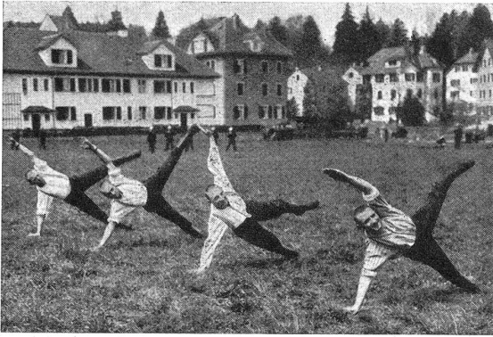
Unsere Radfahrer. — Nos cyclistes. Eine turnerische Frühstunde eröffnet den arbeitsreichen Tag. L'heure matinale de gymnastique ouvre la journée chargée de travail.

sichten auf Lage und Gelände möglich oder geradezu geboten wäre.