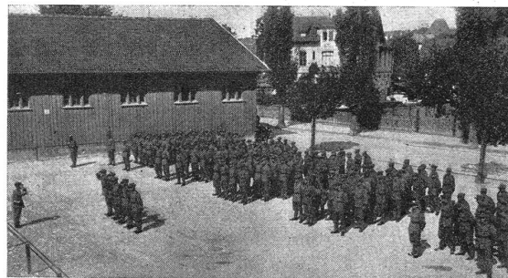
Unsere Radfahrer. — Nos cyclistes. Hauptverlesen vor dem Abendausgang. L'appel principal avant la déconsignation du soir.

Wo die Flieger- und Erdaufklärung versagt, ist man über das Handeln des Gegners im ungewissen. Mel-