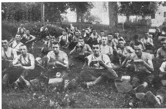
Unsere Radfahrer. — Nos cyclistes. Wohlverdientes Mittagessen im Freien. — Un dîner en plein air bien mérité

Die Besorgnis, von Fliegern entdeckt zu werden, ist noch viel zu vorherrschend. Die ängstliche Rücksicht auf feindliche Flieger lähmt den Führerwillen und hemmt den