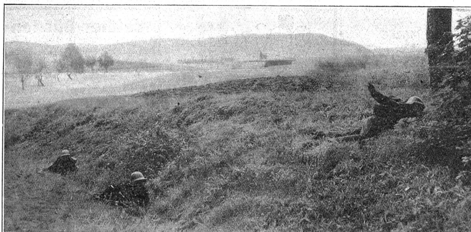
Der Führer der Gefechtsgruppe gibt das Zeichen zum Vorrücken. Le chef du groupe de combat prononce le „en avant“.