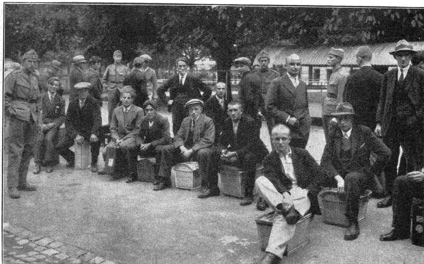
Von der I.-R.-S. IV/3 in Thun 1931. Gespannt harren die werdenden Rekruten im Kasernenhof der Dinge, die da kommen sollen.