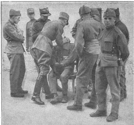
Von der I.-R.-S. IV/3 in Thun - 1931 - L'E. R. I. IV/3 à Thoune. Zähne und Rachen werden inspiziert durch den Schularzt. Les dents et la gorge sont inspectées par le médecin d'école.

Wir finden den Namen Stäheli auf die Distanz von 300 und 50 Meter an zahlreichen frühern Zentralfesten der Unteroffiziere an erster Stelle, so 1895 in Aarau, 1897 in Zürich, 1899 in Basel, 1901 in Vevey, 1903 in Bern, 1908 in Winterthur und 1911 in St. Gallen. Auch nach dem Aktivdienste, bei den jährlichen dezentralisierten Verbandsschießen, war er in immer uneigennütziger Weise bestrebt, uns seine Dienste zu widmen und belegte zu verschiedenen Malen die ersten Ränge.