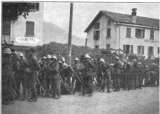
I.-R.-S. V/5 1931 auf Mte. Ceneri.

Auch die sehnsüchtig erwartete Post führen wir jeweils mit. Jene verschlossenen Säcke mit den tausend