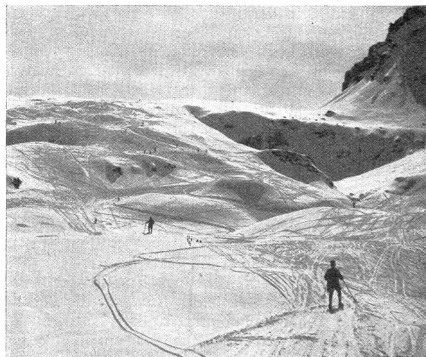
Abfahrtsgelände oberhalb Gaffia Champs de descente au dessus de Gaffia

Der Fourier ist für den Postdienst der Einheit und für die Ordnung und Arbeit im Büro verantwortlich. Er kommandiert die Postordnung zu allen Fassungen, bei welchen Post übernommen wird, und teilt ihr alle Mutationen in der Einheit mit. Er führt das Taschenbuch des Rechnungsführers. Er verwaltet getrennt die allgemeine Kasse, die Haushaltungskasse und allfällig von Leuten der Einheit ihm zur Verwahrung übergebenes Geld.