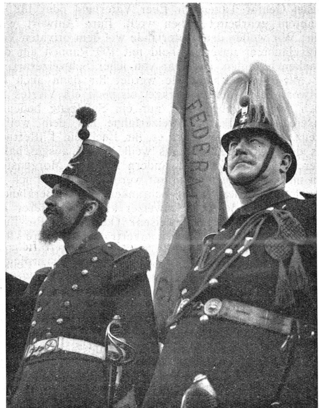
Markige, alte Soldatengestalten im Festzug Mâles visages d'anciens soldats participant au cortège

Draußen am Rande der Stadt starteten währenddessen bereits die ersten Infanteriepatrouillen . Es hatten