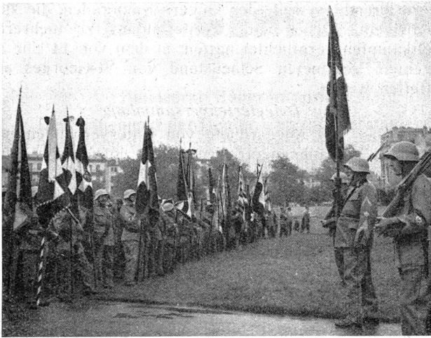
Zentralfahne und Sektionsfahnen bei der Ansprache des Präsidenten des Organisationskomitees. La bannière centrale et les drapeaux des sections pendant le discours du président du comité d'organisation.

Farbenpracht und seiner patriotischen Note mit dem Vorangegangenen wieder aus.