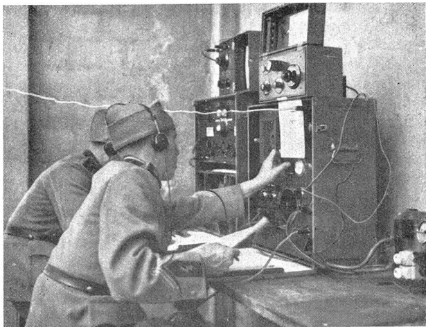
Wettübungen der Funker. — Le concours des radio-télégraphistes.