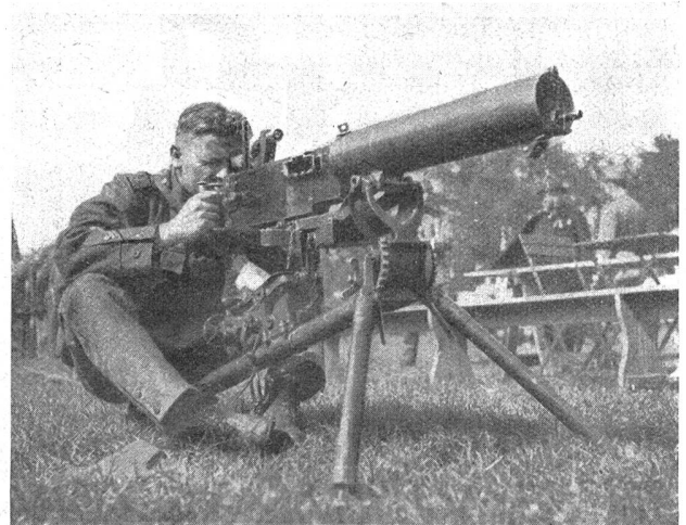
Übungen am Maschinengewehr. — Exercices à la mitrailleuse.

hatte während aller vier Tage außerordentlich lebhafter Betrieb geherrscht, der zeitweise an das Gedränge großer Schützenfeste erinnerte. Sie können schießen, die Unteroffiziere der Schweizerischen Armee! Ihre bewunderungswürdige Handhabung der Waffe hat die schönsten Berechnungen der Verbandsleitung und der Organisatoren der Veranstaltung über den Haufen geworfen! Die höchste Auszeichnung, die Plakette mit Diplom, war auf 90 Punkte festgelegt worden auf Grund bisheriger Erfahrungen. Die Rangliste zeigt, daß mehrere Sektionen mit ihrem Durchschnitt auf dieser respektablen Höhe stehen. Die Schießleistungen erwecken um so größere Bewunderung, als es sich um das schwierigere Scheibenbild B mit Einteilung in 10 Kreise handelt mit einem Zehner von 15 cm Durchmesser, dessen Anblick noch wesentlich erschwert war dadurch, daß das Weiße