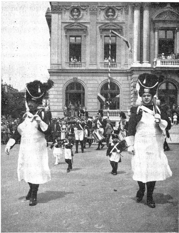
Alte Sappeure. — Anciens sapeurs.