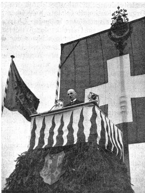
Bundesrat Häberlin spricht zu den schweizerischen Unteroffizieren. Le conseiller fédéral Häberlin cause aux sous-officiers suisses.

herrschte am Samstag bereits in aller Frühe reges Leben. Gewitzigt durch trübe Erfahrungen in Solothurn, wo die am stärksten besetzten Wettkämpfe in den ersten Stunden zu wenig belegt, gegen den Schluß hingegen überlastet waren, hatten sich viele der Konkurrenten zur Pflicht gemacht, mit ihrer Arbeit gleich in der ersten Stunde zu beginnen. Auf der Handgranatenwurfbahn fielen schon die ersten Grenadiere auf durch korrekte Stellungen und taktisch richtiges Verhalten, so daß ein augenfälliger Fortschritt gegenüber Solothurn zu verzeichnen war. Wohl zeigten sich da und dort noch vereinzelte Verstöße gegen die Wurftechnik, die zu Punktabzügen oder zur Disqualifikation führten, aber sie waren viel weniger zahlreich als in früheren Wettkämpfen.