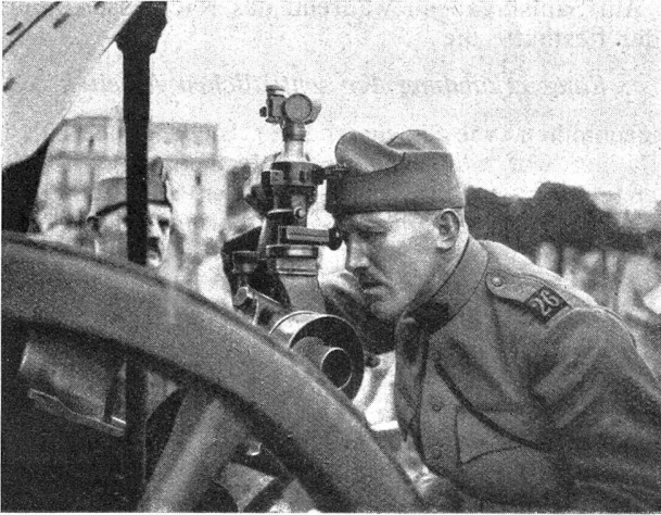
Wettübungen im Richten Concours de pointage