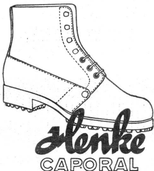
mit dem goldenen Absatznagel

Schiebedose Fr. 1.25, Tuben Fr. 1.25 und 2.— Zu haben in allen Apotheken / Schweizer Präparat