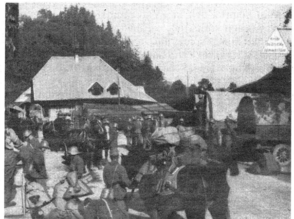
W.-K. der Geb.-I.-Br. 9 — C. R. de la Br. I. mont. 9 Fassungsplatz Eggiwil — La place de ravitaillement d'Eggiwil

Eingeleitet wurde die Schlacht durch ein großes Reitergefecht bei Liebertwolkwitz am 14. Oktober, das