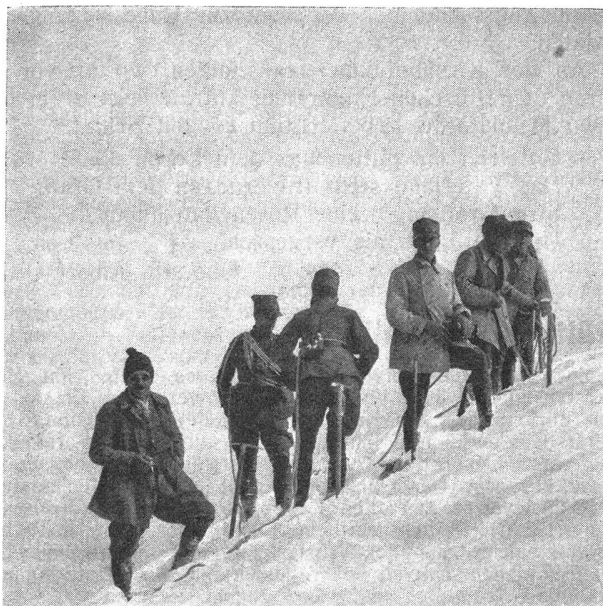
Gipfelrast auf dem Wetterhorn