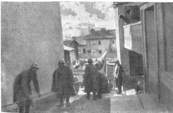
Eine 12-cm-Kanone wird in einem Bergdorf in Stellung gebracht Mise en position d'une pièce de 12 cm dans un village de montagne

De ces trois manières, la plus usitée et la plus rapide est certainement celle qui a recours à la force musculaire des canonniers, lesquels du reste la préfèrent