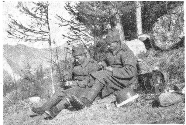
Die Telefonsoldaten eines Art.-Kdo.-Postens stärken sich während einer Feuerpause

Les Téléphonistes d'un P. C. d'artillerie se restaurent pendant une interruption de feu. Manœuvres du Rgt. Inf. mont. 6