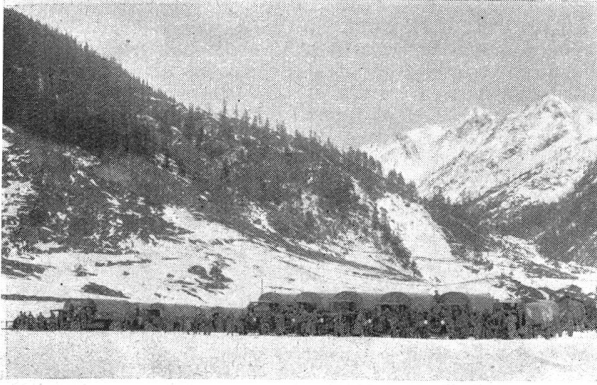
Park einer schweren Mot.-Kan.-Abt. in 1640 m Höhe Parc d'un groupe de canons lourds automobiles à 1640 m d'altitude

l'endroit que son commandant a choisi pour la mettre en position, le travail des canonniers commence alors et je vous assure qu'il faut avoir vu ces derniers à l'œuvre pour se rendre compte de la somme d'efforts violents qu'ils doivent fournir.