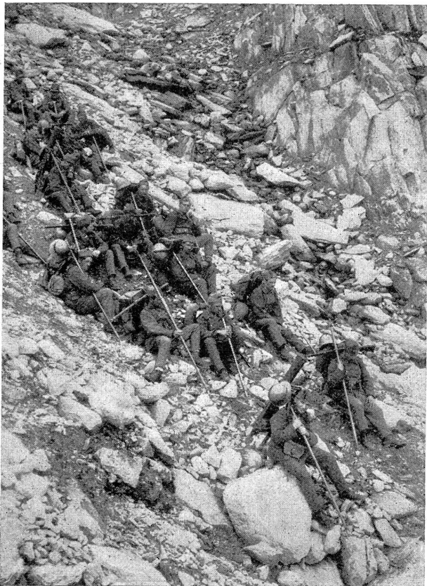
Gebirgsdienst — Service en montagne

Rast beim Aufstieg zum Guspisgletscher von N-O