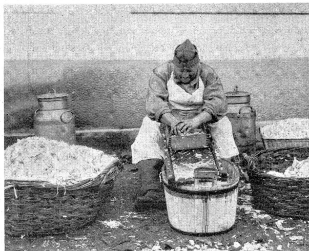
Allerlei aus dem Soldatenleben. Heut' gibt's Kabissalat!

Japanische Blätter veröffentlichen Einzelheiten über das neue Flottenprogramm, dessen Verwirklichung im nächsten, am 1. April 1934 beginnenden Finanzjahr in Angriff genommen werden und im am 30. März 1938 zu Ende gehenden Finanzjahr vollendet werden soll. Die Ausführung des ganzen Planes dürfte 590 bis 670 Millionen Yen erfordern, von denen im nächsten Finanzjahr 180 Millionen ausgegeben werden sollen. Es ist beabsichtigt, bis 1938 im ganzen 36 neue Kriegsschiffe zu bauen, darunter 2 Flugzeugmuttertschiffe, 10 Unterseeboote usw. Im ganzen verlangt das Marineministerium im nächsten Finanzjahr 370 Millionen Yen, es stellt somit an den Staat, dessen Etat für das nächste Finanzjahr jetzt ausgearbeitet wird, die höchsten Ansprüche, noch höhere als das Kriegsministerium, das 330 Millionen Yen beansprucht. Das Marineministerium hielt diese Neubauten schon lange für notwendig, die unmittelbare Entscheidung aber führte der Beschluß des amerikanischen Marineministeriums herbei, mit der Durchführung seines neuen Programms zu beginnen. Obwohl Amerikaner versicherten, daß dieses Programm keine Erhöhung der amerikanischen Kriegsflotte bedeute, daß es sich nur um einen Ersatz veralteter Schiffe durch moderne handle und daß die Vereinigten Staaten die ihnen im Abkommen von Washington eingeräumte Tonnenzahl noch gar nicht erreicht haben, wurden die amerikanischen Schiffsbestellungen für Japan zum Anlaß, seinerseits die Verwirklichung seines Marineprogramms zu beschleunigen.