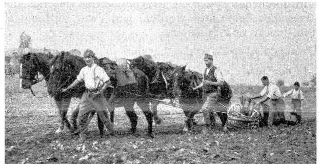
Allerlei aus dem Soldatenleben. Der Kontakt mit der Zivilbevölkerung wird auf nutzbringende Art aufrechterhalten.

Die Flottenkommission des Senats sprach sich am 20. Februar entschieden gegen jede Abrüstung Frankreichs zur See