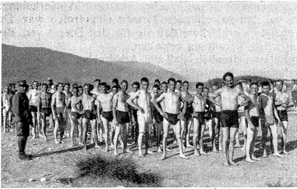
Allerlei aus dem Soldatenleben. Ein frisches Bad nach strenger Tagesarbeit findet freudigen Anklang. Croquis de la vie de soldat. Quel plaisir après le travail pénible de la journée que de pouvoir prendre un bain rafraîchissant.