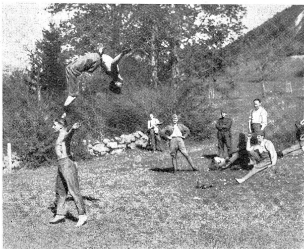
Allerlei aus dem Soldatenleben. Der Akrobat vergißt auch im Militärdienst das Training nicht.

Croquis de la vie de soldat. L'acrobate, même lorsqu'il est sous l'uniforme, n'oublie pas l'entraînement.