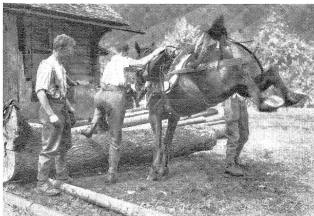
Allerlei aus dem Soldatenleben. Ein ungemütlicher Herr! Croquis de la vie de soldat. Un « monsieur » peu agréable!

In den Vereinigten Staaten von Nordamerika unternimmt man Versuche, Truppen im Flugzeug zu transportieren und hinter der feindlichen Front zu landen. Das begegnet natürlich besonders Landungsschwierigkeiten, weshalb für solche Unternehmungen am ehesten Wasserflugzeuge in Betracht fallen. Auch hat man Versuche unternommen, die Mannschaften mittels Fallschirmen abspringen zu lassen. So wurde beispielsweise eine Gruppe von sechs Mann, einem Maschinengewehr und der nö-